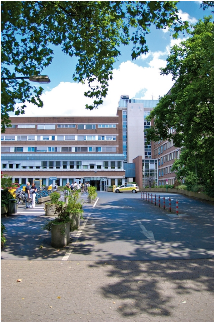
Abbildung: Das Marien Hospital Düsseldorf

Das Marien Hospital Düsseldorf ist ein Akutkrankenhaus und seit 1864 in katholischer Trägerschaft. Dieser Tradition fühlen sich unsere Mitarbeiter bis heute in ihrem täglichen Dienst am Patienten verpflichtet.